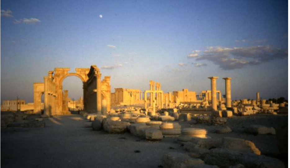
En haut : temple de Baalshamin, photo Paul Collart, Archives Paul Collart, Université de Lausanne ; en bas : temple de Bél vu depuis l'arc de la grande voie à colonnade de Palmyre, photo Pierre Gros.