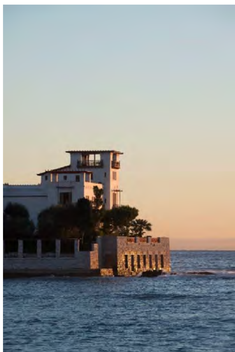
Villa Kérylos

Conçue et réalisée entre 1902 et 1908 sur le modèle des maisons les plus riches de l'île de Délos (II e siècle av. J.-C.), la villa Kérylos est le fruit de la collaboration de l'archéologue et mécène Théodore Reinach, propriétaire et commanditaire, et de l'architecte Emmanuel Pontremoli.