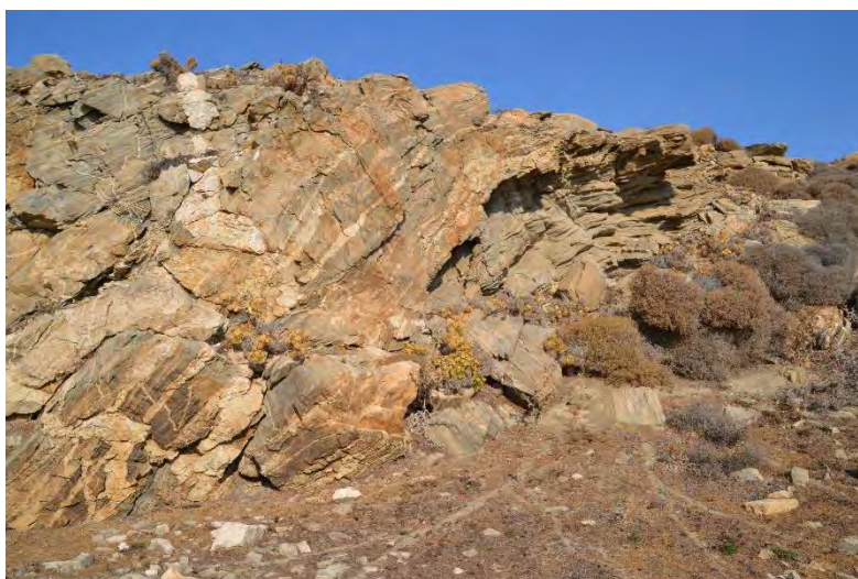
Un front de taille dans une carrière de gneiss

Enfin, l'exposition s'achève autour de la présentation détaillée des quatre édifices évoqués tout au long du parcours. Finement analysés, ils livrent les secrets des roches qui les constituent. Ces résultats ouvrent un large éventail de thématiques et de questions. Comment les Naxiens au VI e s. av. n. è. ont-