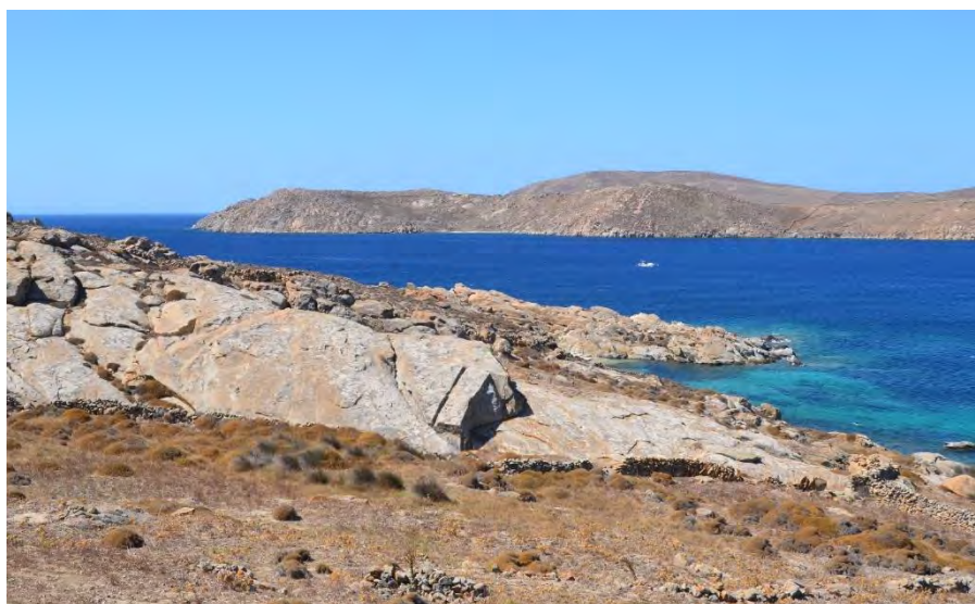
Une carrière de granite dans le sud de Délos, EFA - GAD.