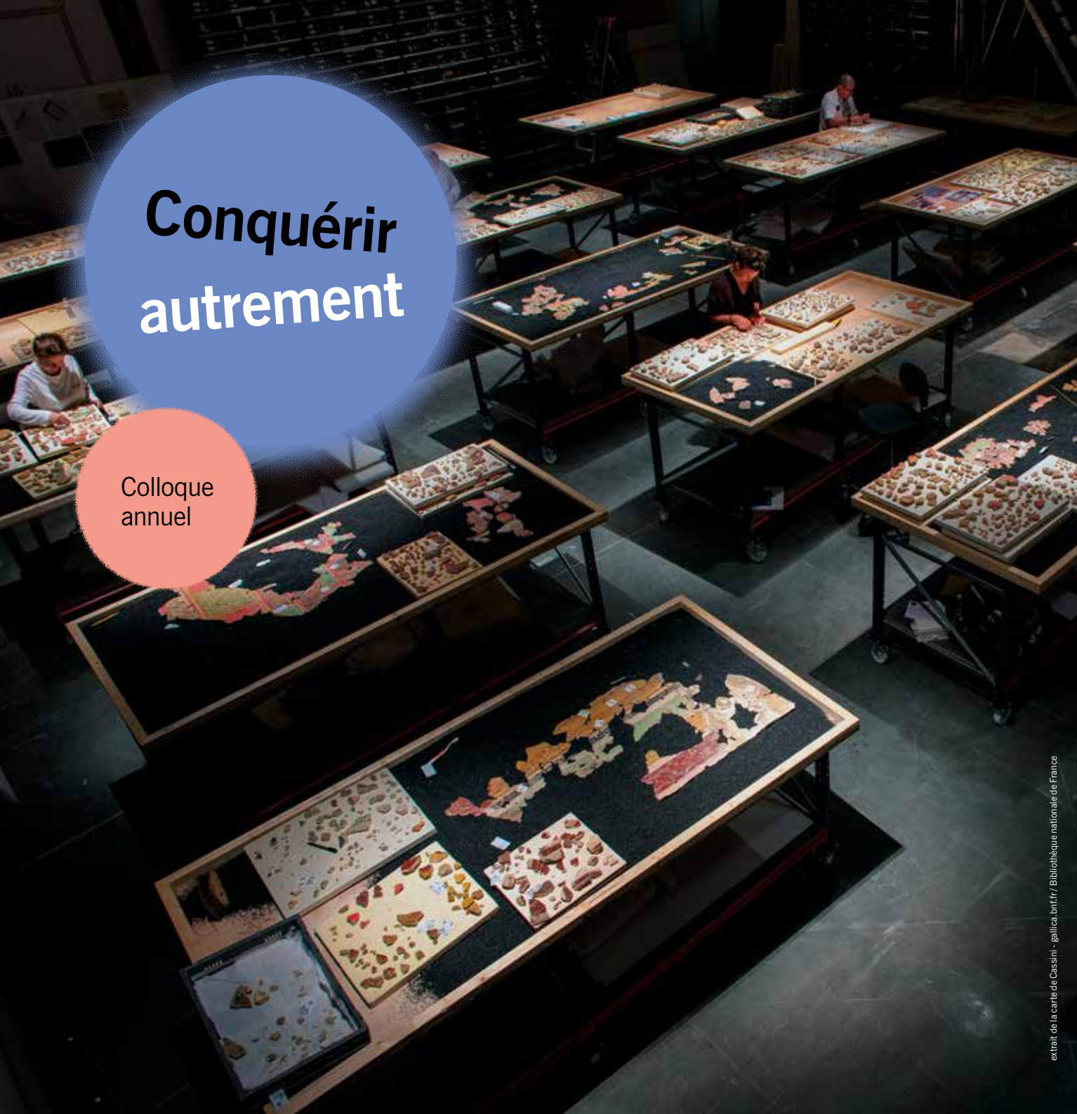
extrait de la carte de Cassini

Accès libre sur réservation et dans la limite des places disponibles sur inrap.fr . Le programme du colloque est accessible sur inrap.fr . L'accueil se fera à partir de 8h30.