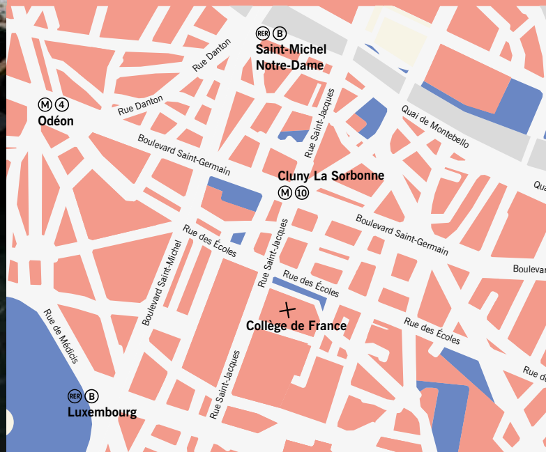
Graphisme: c-album