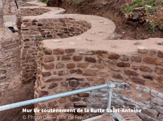
Mur de soutènement de la Butte Saint-Antoine