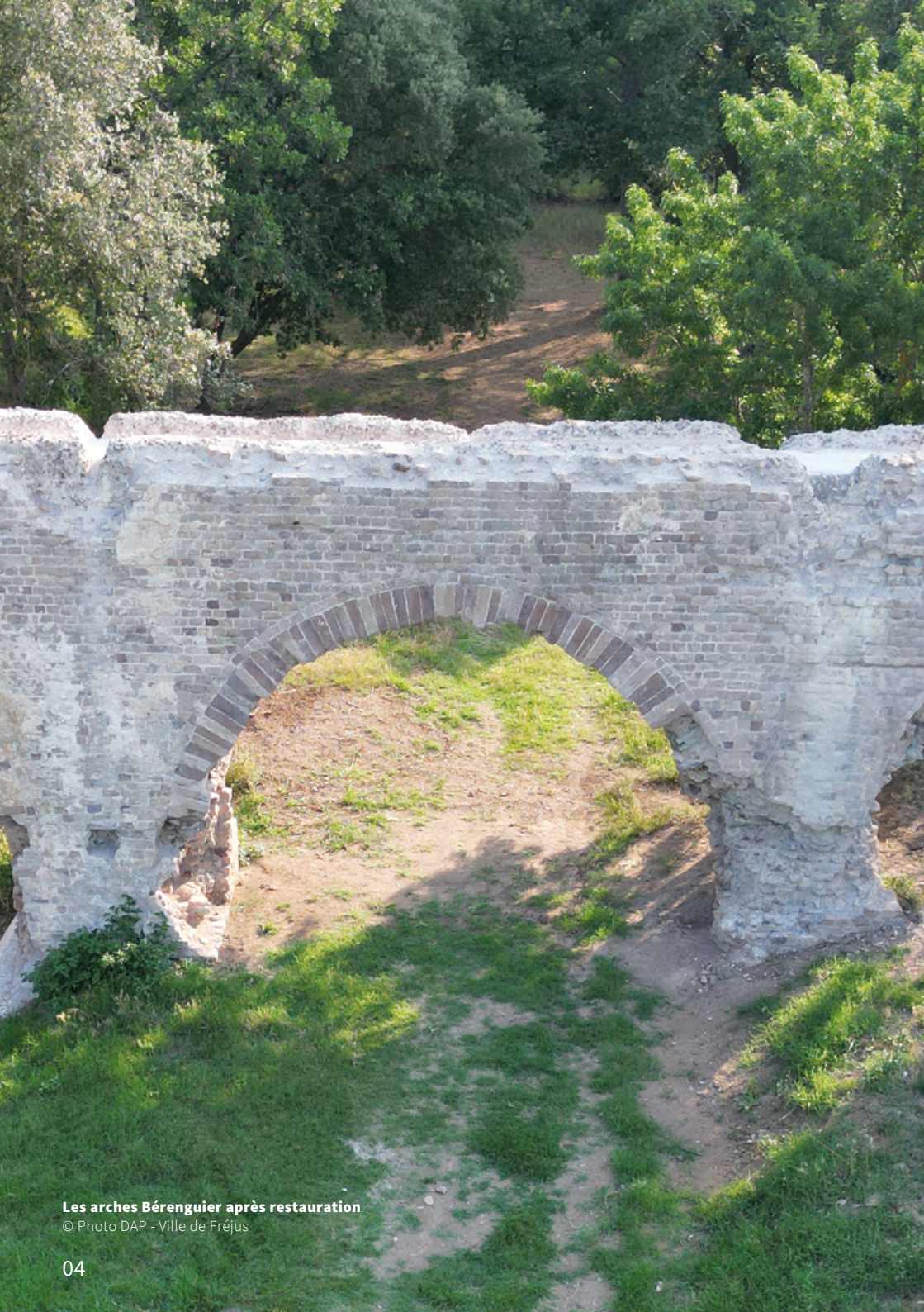
Les arches Bérenguier après restauration