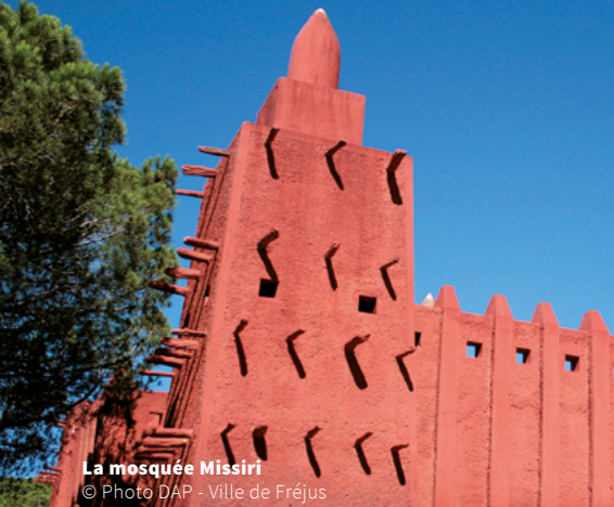
La mosquée Missiri