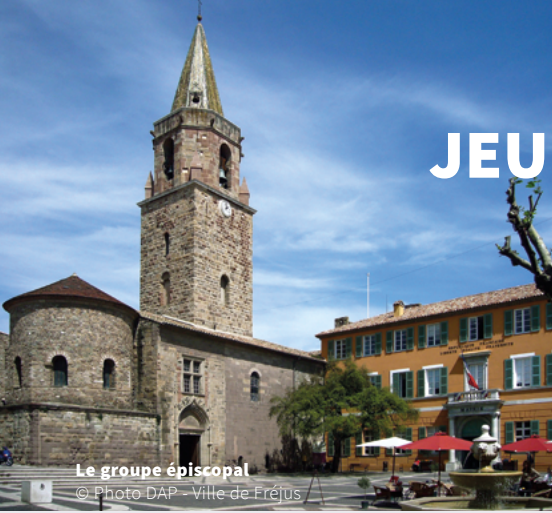
Le groupe épiscopal