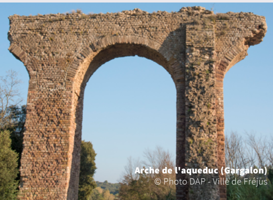
Arche de l'aqueduc (Gargalon)

Tenter de redonner une idée crédible d'ensembles aussi complexes que les villes antiques, implique une méthodologie issue de l'étude de cas concrets et de la collaboration entre l'archéologue et l'architecte. Ceci consiste en l'élaboration d'un modèle théorique. Il s'agit pour les chercheurs de se transmettre, à un moment de leur réflexion scientifique, une idée claire, certes perfectible, mais qui a le mérite d'être compréhensible pour le public. De nombreux exemples (Arles, Lutèce, Lyon, Nîmes, Narbonne, Fréjus !) aideront à comprendre le cheminement de la pensée, les problèmes rencontrés et les solutions proposées.