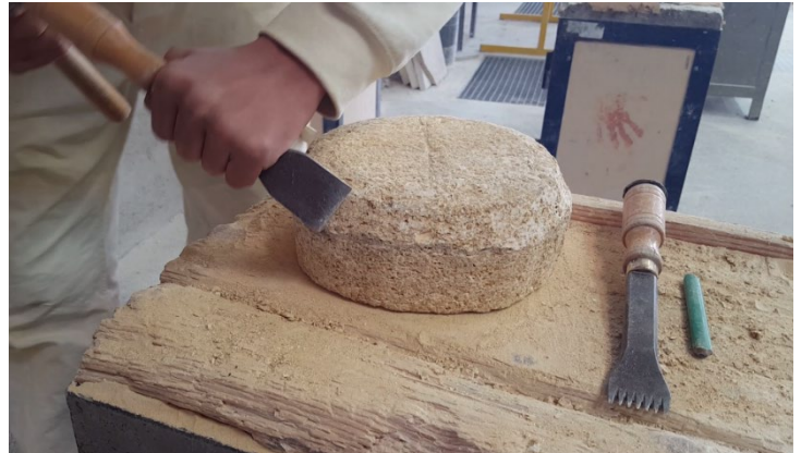
Atelier taille de pierre – Lycée professionnel - Les Alpilles, Miramas