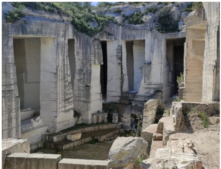
Carrière de Sarragan - Les Baux-de-Provence

La formation est appelée à prendre un rythme annuel et à être organisée en Grèce, en Italie, dans les territoires romanisés d'Occident.